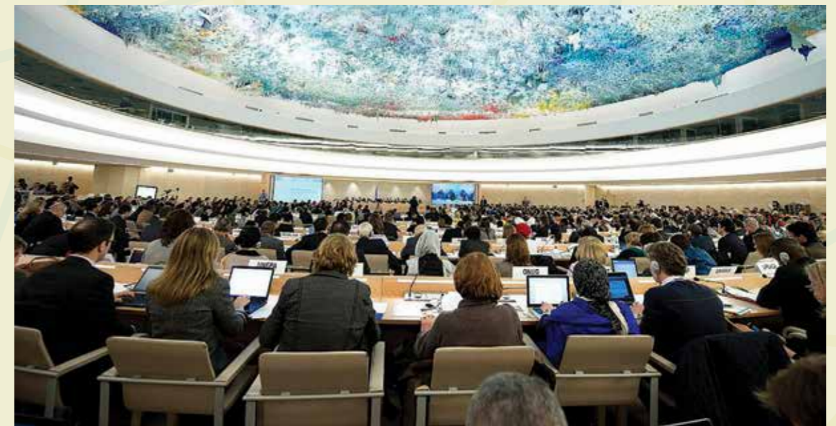
Comhairle na Náisiún Aontaithe um Chearta an Duine, an Ghinéiv

I mí an Mheithimh 2016, cúig bliana tar éis gur foilsíodh Prionsabail Threoracha na Náisiún Aontaithe, ghlac Comhairle an Aontais Eorpaigh Conclúidí 2 lena ndearnadh athdhearbhú ar rannpháirtíocht láidir, ghníomhach an Aontais ar mhaithe le mí-úsáid a chosc agus leigheas a áirithiú ar fud an domhain, agus lena chinntiú go gcuirfí chun feidhme Prionsabail Threoracha na Náisiún Aontaithe. Thug an Chomhairle chun cuimhne an gealltanais ó Bhallstáit an Aontais Eorpaigh go ndéanfaidís Pleananna Gníomhaíochta Náisiúnta a ullmhú agus a ghlacadh agus leag sí béim ar an ról suntasach is cóir a bheith ag an lucht gnó i dtaobh cuidiú Clár Oibre 2030 um Fhorbairt Inbhuanaithe a chur chun feidhme, agus é á aithint aici gur gné dhílis den fhorbairt inbhuanaithe is ea urramú chearta an duine ag corparáidí.