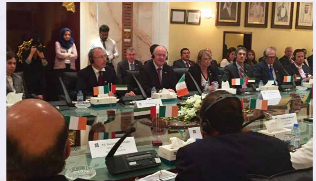
An tAire Charlie Flanagan ag labhairt ag cruinniú de bhreis is 50 cuideachta áitiúla agus 35 cuideachta Éireannach ag imeacht líonrú Fiontraíocht Éireann i Abu Dhabi, Aontas na N-Éimíochtaí Arabacha, mar chuid de mhisean trádála chuig réigiún na Murascaille i mí na Samhna 2016