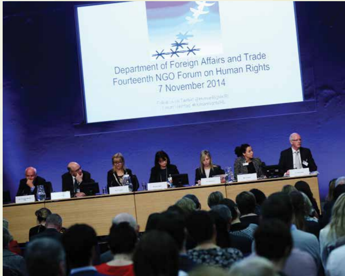
An Fóram RGE-NGO maidir le Cearta an Duine 2014 ag pléigh Gnó agus Cearta an Duine, Caisleán Bhaile Átha Cliath

Tugtar le chéile sa Phlean Náisiúnta seo na buncheisteanna a aithníodh san Imlíne Oibre agus leagtar amach treo-chlár maidir le roinnt gníomhaíochtaí a chur chun feidhme thar thréimhse trí bliana, rud a chuirfidh ar chumas na hÉireann cuspóirí Phrionsabail Threoracha na Náisiún Aontaithe a bhaint amach. Tá sé ceaptha le bheith ina cháipéis bheo a nuashonrófar go rialta chun freagairt don mhéid a tharlóidh amach anseo. Tá sé i gceist chomh maith fóram de na páirtithe leasmhara éagsúla a thionól chun breathnú ar an dul chun cinn a dhéanfar i leith an phlean sa chéad dá bhliain.