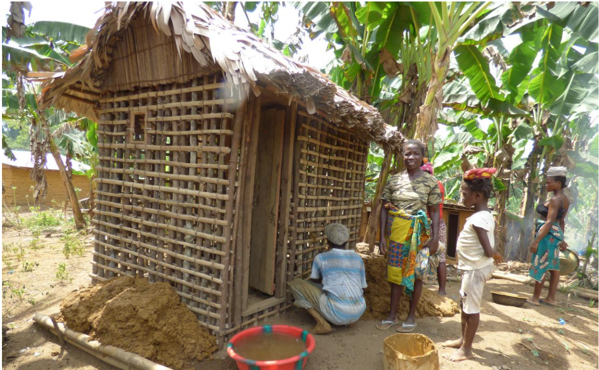
Tagann muintir sráidbhaile atá gar do Boegessay i gcontae Rivercess le chéile chun leithreas poill níos fearr a thógáil le tacaíocht na hÉireann trí Oxfam International

Chomh maith leis an gclársceidealú thuas, tá an Ambasáid ag gabháil d'abhcóideacht pholaitiúil leis an rialtas, leis an tsochaí shibhialta agus leis an bpobal idirnáisiúnta chun tacú le foréigean gnéasach agus inscne (SGBV) a chosc agus freagairt dó, agus le saincheistanna níos leithne MSS. Chomhoibrigh Éire le Rialtas na Libéire, tríd an Aireacht Inscne, maidir le dréachtú a dara Plean Gníomhaíochta Náisiúnta agus suíonn sí ar an gCoiste Stiúrtha lena chur chun feidhme. Bhí ionadaithe ó shochaí shibhialta na Libéire páirteach sa phróiseas comhairliúcháin don tríú PGN in Éirinn freisin, ag tógáil ar chleachtaí comhroinnte ceachta níos túisce. Tacaíonn an Ambasáid tuilleadh le hiarrachtaí chun próifíl chlár oibre MSS na Libéire a mhéadú ar an ardán idirnáisiúnta, lena n-áirítear trí rannpháirtíocht an Aire Inscne a éascú ag imeachtaí iltaobhacha i gcomhthéacs Sheachtain MSS na Náisiún Aontaithe agus an Choimisiúin um Stádas na mBan, agus trí MSS agus saincheistanna inscne a ardú go rialta ag Cumraíocht na Libéire ar Choimisiún Síochánaíochta na Náisiún Aontaithe i Nua-Eabhrac. Sa bhliain amach romhainn, tá súil ag an Ambasáid leanúint le cumas sa réimse seo a neartú, lena n-áirítear trí oiliúint a chur ar choimeádaithe síochána ban na Libéire in Éirinn agus trí scoláireachtaí a thairiscint do mhic léinn na Libéire ar spéis leo a gcuid eolais ar chúrsaí MSS a fhorbairt.