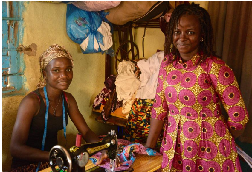
Tá saincheapadh na hoiliúna mar chuid de chlár scileanna do mháithreacha óga i dtionscadal ‘Fambul Welbodi’ (‘Sláinte an Teaghlaiigh’) de chuid Save the Children, a mhaoinítear mar chuid d’obair na hÉireann chun mná agus cailíní a chumhachtú.

agus le cumhachtú na mban i 57 tír agus críoch leochaileach ina bhfuil coinbhleacht 6 . Fuarthas amach go gcuireann 86% den chúnamh a infheistíonn Éire i gcomhthéacsanna leochaileacha le comhionannas inscne. Tá sé seo i measc na sciartha is airde de chabhair atá dírithe ar chomhionannas inscne i gcomhthéacsanna leochaileacha de dheontóirí uile DAC, ag teacht sa cheathrú háit tar éis Cheanada, na hÍoslainne agus na Sualainne.