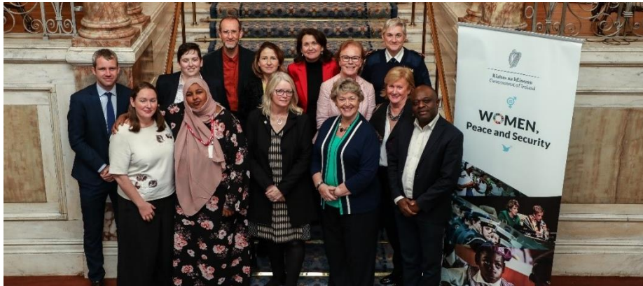
Baill an Ghrúpa Maoirseachta don tríú Plean Gníomhaíochta Náisiúnta ag Cruinniú tionscnaimh an Ghrúpa

thábhachtach seo, saincheist leathan. Tá Téarmaí Tagartha do Bhaill an Ghrúpa Maoirseachta ceangailte le hlarscríbhinn 2.