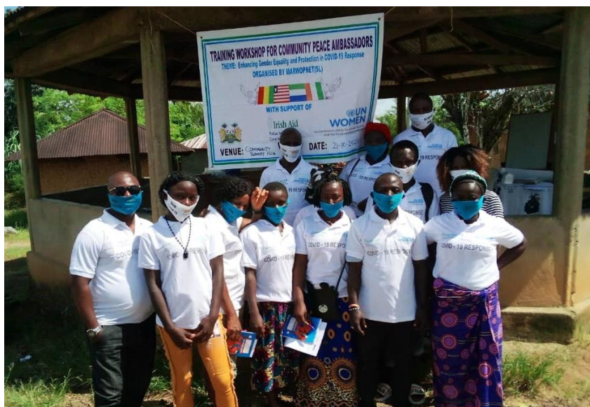
Oiliúint MARWOPNET ar ambasadóirí síochána in Freetown

Bhí ról ceannasach ag an Misean maidir le hinscne a chomhtháthú i bhfreagairt an Rialtais ar COVID-19. Thacaigh sé leis an Aireacht Inscne agus Gnóthaí Leanáí (MoGCA) a gCreat COVID-19 atá Freagrúil ó thaobh Inscne de a chur chun feidhme trí bheirt Saineolaithe Inscne a dhaingniú sa struchtúr ceannais freagartha ar an leibhéal náisiúnta agus cúigear Saineolaithe Inscne ar leibhéal na gceantar. I gcomhpháirtíocht le Mná na Náisiún Aontaithe, thacaigh sí freisin leis an Oifig Staidrimh Náisiúnta chun measúnú mear inscne a dhéanamh ar thionchar COVID-19 ar mhná. Agus COVID-19 á aithint mar shaincheist MSS, thacaigh an Misean trí Mhná na Náisiún Aontaithe le hoiliúint a chur ar Ambasadóirí Síochána Ban Phobal den Mano River Union Peace Network (MARWOPNET), eagraíocht réigiúnach ban, maidir le comhionannas inscne agus cosaint a fheabhsú i bhfreagairt COVID-19 i 20 pobal trasteorann taoiseachta.