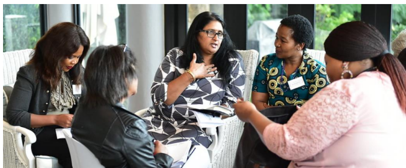
Comhairliúcháin na hAfraice Theas

Mar fhreagra air sin, thug Éire, i gcomhar le Mná na Náisiún Aontaithe agus Lónra Domhanda Tógálaithe Síochána na mBan (GNWP), tógálaithe síochána mná ó chúlraí agus ó chomhthéacsanna éagsúla sa Cholóim, i dTuaisceart Éireann, san Afraic Theas agus in Uganda le chéile chun clár oibre MSS a mheas in 2020, agus tionchar COVID-19 ar a gcuid oibre. I measc na gcomhairliúcháin sin a reáchtáladh le cúnamh ónár nAmbasáidí i mBéal Feirste, i mBogotá, in Kampala agus in Pretoria, bhí mná a raibh taithí acu ar thógálaithe síochána agus dhírigh siad ar na sé réimse tosaíochta a d'aithin Ard-Rúnaí na Náisiún Aontaithe.